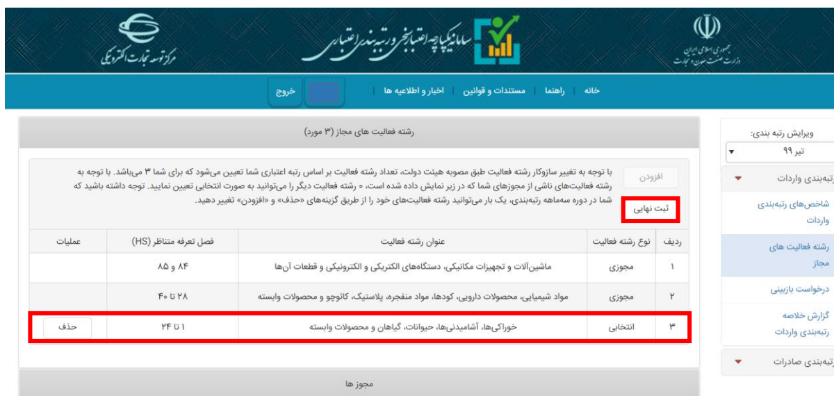
تصویر ۶- ثبت نهایی رشته فعالیت‌ها

توجه داشته باشید که پس از افزودن رشته فعالیت‌های خود حتما بر روی گزینه "ثبت نهایی" کلیک نمایید تا اطلاعات شما در سیستم بررسی ثبت سفارشات به روزرسانی گردد.