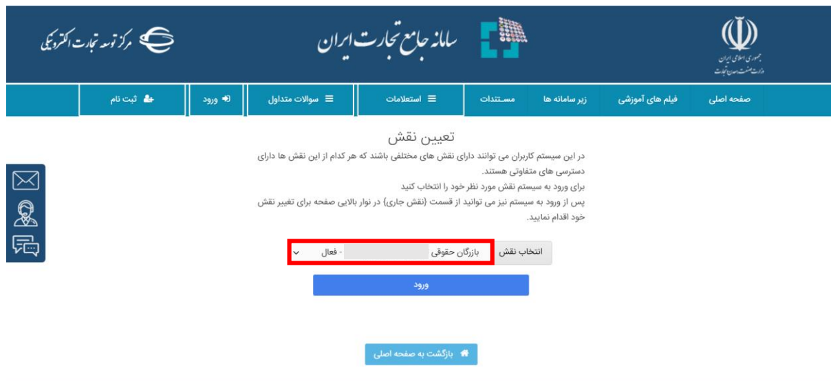
تصویر ۱- تعیین نقش

جهت انتخاب رشته فعالیت‌های کارت بازرگانی، می‌بایست ابتدا با مشخصات کاربری خود وارد سامانه جامع تجارت به آدرس https://www.ntsww.ir شده و مطابق تصویر ۱ متناسب با نوع شخص، نقش "بازرگان حقیقی-فعال" یا "بازرگان حقوقی-فعال" را انتخاب نمایید.